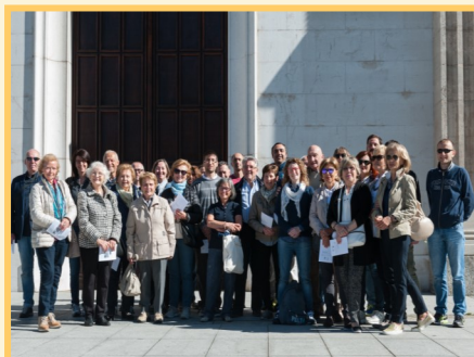
La visita del 13 maggio scorso