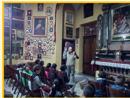
Le visite degli studenti della scuola Cadorna

Il 20 maggio sono iniziate le Visite guidate al Cimitero Principale di Seregno